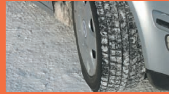
冬天雪道专用轮胎是租车公司车子的标准配备。

在北海道有很多只有冬天才能享受到的乐趣，如滑雪、滑雪板和露天温泉等等。因此所携带的防寒衣物或道具等等也相当多。所以利用租车来移动是非常有用的。虽然这么说，但是冬天道路的驾驶难度相当高。为避免引起不必要的纠纷，事先先做好基本知识的准备功课吧。